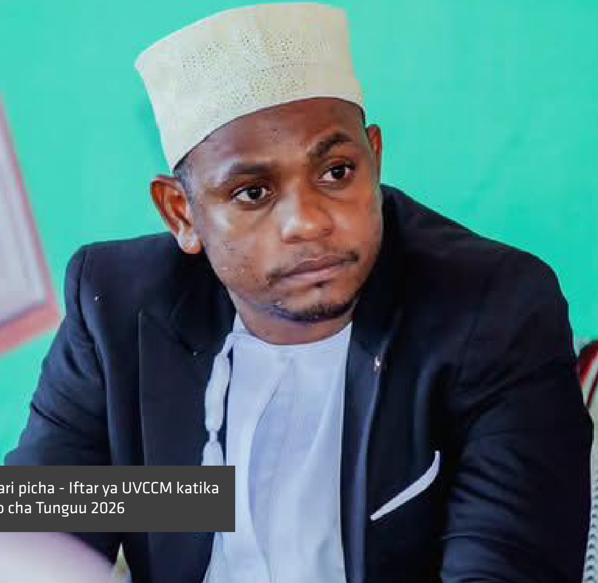
Habari picha - Iftar ya UVCCM katika Chuo cha Tunguu 2026