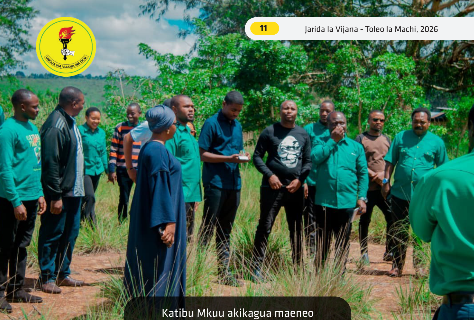
Katibu Mkuu akikagua maeneo Chuo cha Ihemi