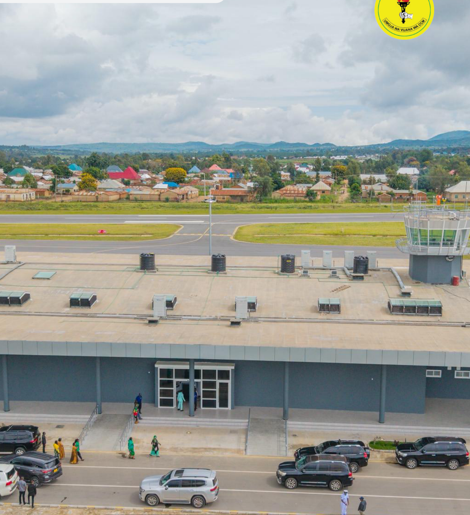
Uwanja wa Ndege wa Sumbawanga